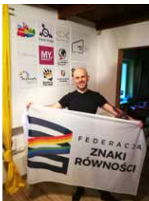
автор: Каспер Потемпский (Kacper Potępski)

Беседовал: Матеуш Гендзба (Mateusz Gędzba)