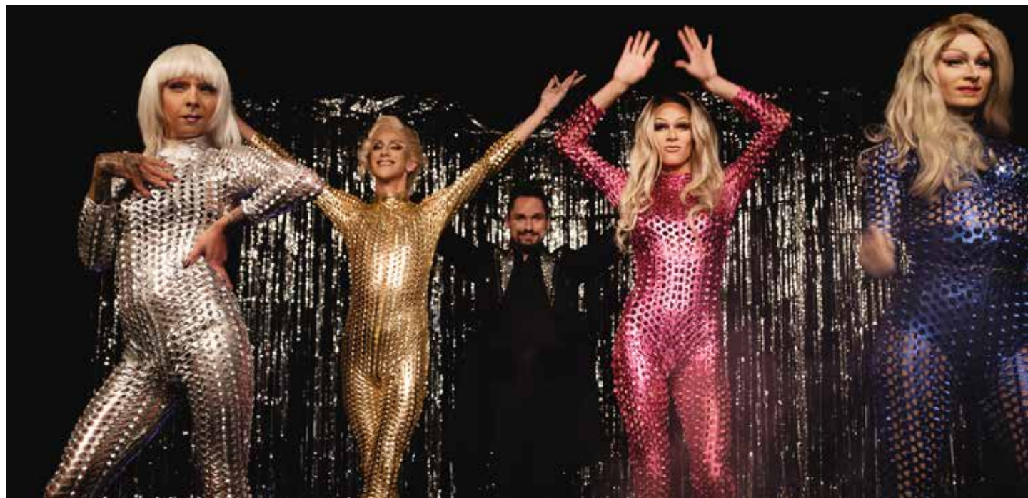
автор: Юлианна Розовская (Juliana Rozowska)

Словарь Коллинза определяет стыд как «неприятное чувство, смущение, которое вы испытываете, когда делаете что-то неправильное или конфузное». В результате таких чувств как одиночество, стыд и сопутствующие им обстоятельства 70% молодых ЛГБТ-людей в Польше приходят к мыслям о самоубийстве. Трудно сказать, сколько подростков