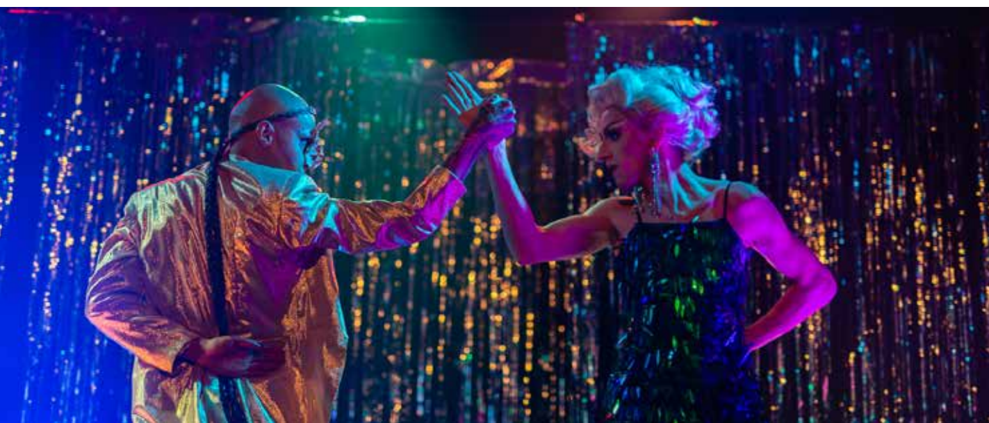
автор: Юлианна Розовская (Juliana Rozowska)

Теперь вы знаете, насколько важна ваша поддержка. Банк «Millenium» 53 1160 2202 0000 0002 1234 9437 Название перевода: «Darowizna na wsparcie psychologiczne» («Пожертвование на психологическую поддержку») Интернет-инициатива: https://zrzutka.pl/z8xuac