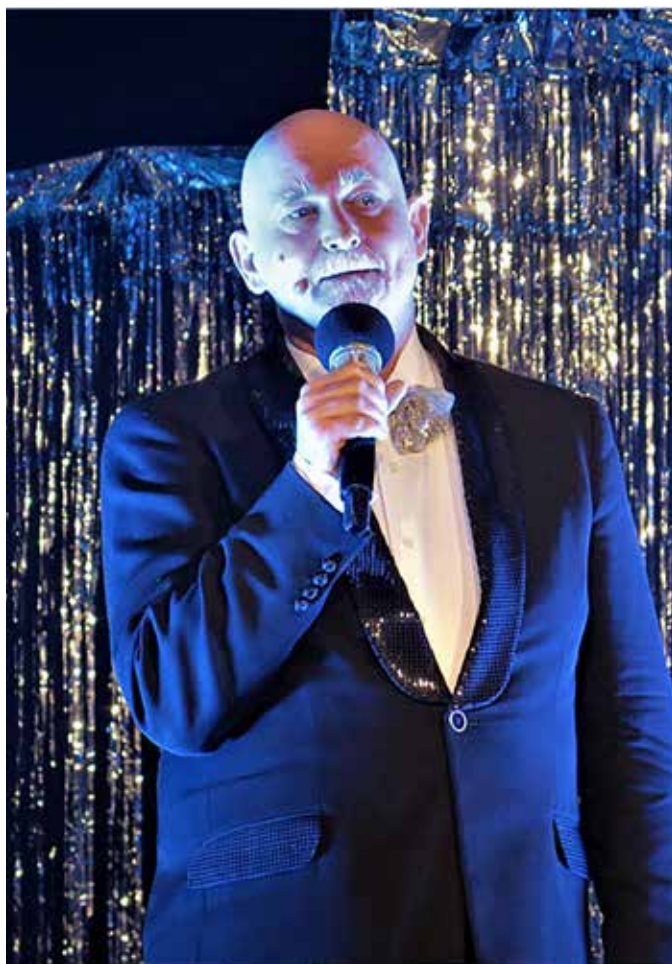
автор: Яцек Графф (Jacek Graff)