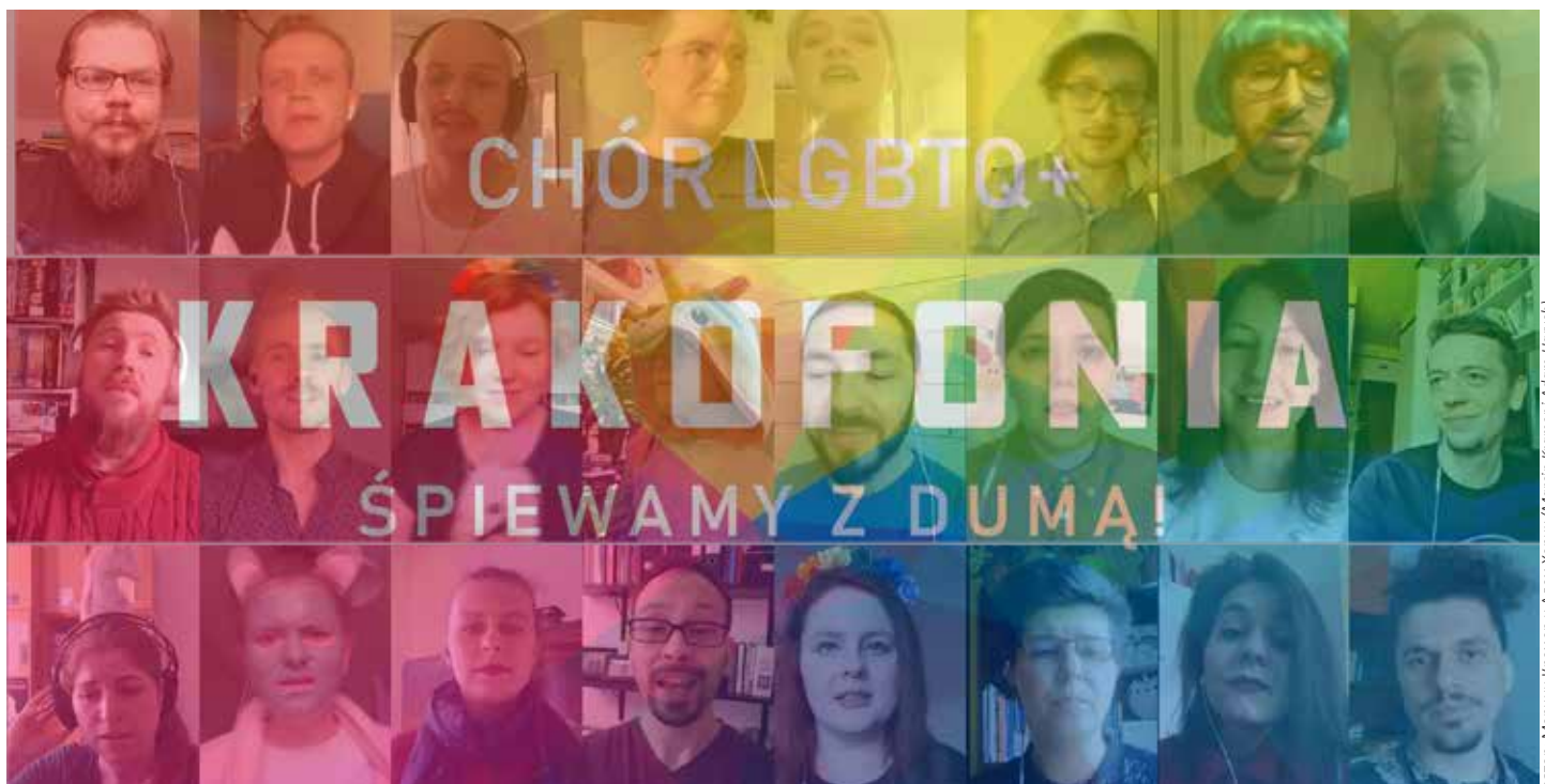
автор: Маршин Крамер и Адам Харн (Marcin Kramer i Adam Harn)

Во время пандемии хор проводил репетиции онлайн. Несмотря на то, что они не столь эффективны как онлайн-репетиции, социальный фактор является очень важным для певиц и певцов. Это отдушину от повседневных проблем. Благодаря совместным занятиям есть возможность поддерживать друг друга. Хор создал внутренний фонд самопомощи, который поддерживает людей, наиболее пострадавших финансово от локдауна. Это действует как «психологический буфер»: дает людям в команде ощущение принадлежности к сообществу, несмотря на то, что они изолированы дома.